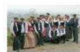
Montanhas e Ribera